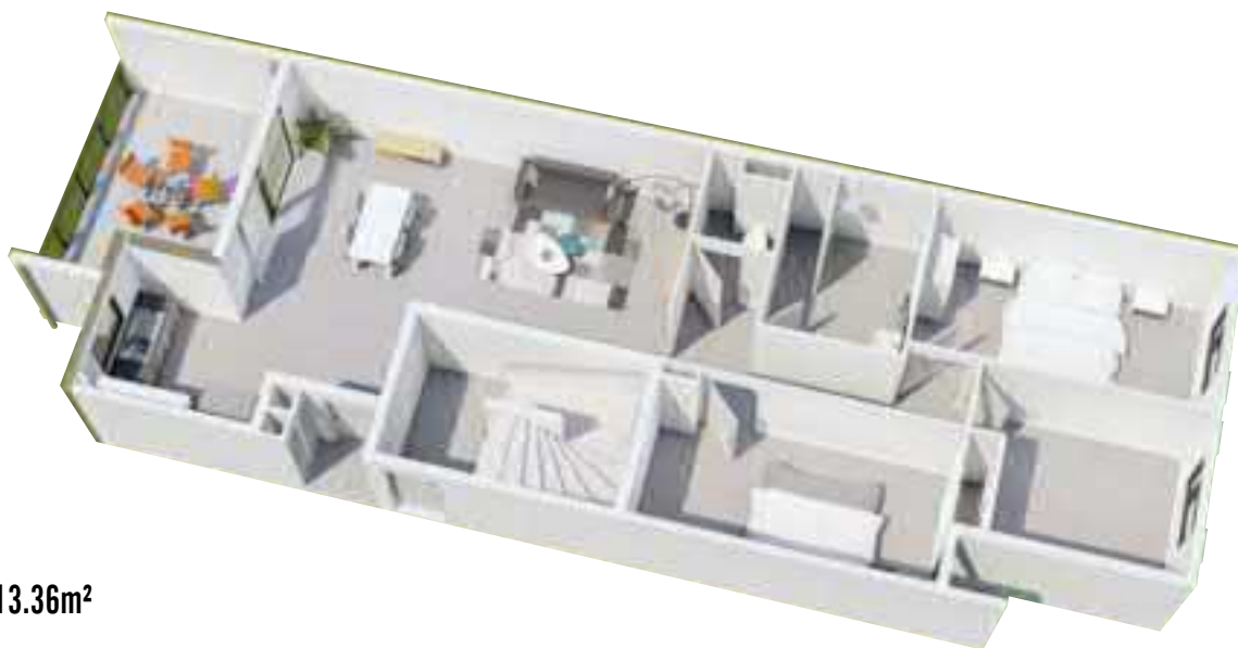
Type T4 - 113.36m 2

La haute qualité des matériaux est ici un gage de luxe, carrelage de grand module finition béton ciré, carrelage sur tous les murs des pièces d'eau, robinetterie et appareillage électrique de grande marque design... Cuisine aménagée...