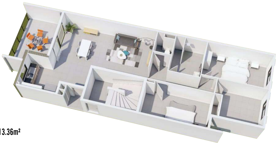
Type T4 - 113.36m 2

La haute qualité des matériaux est ici un gage de luxe, carrelage de grand module finition béton ciré, carrelage sur tous les murs des pièces d'eau, robinetterie et appareillage électrique de grande marque design... Cuisine aménagée...